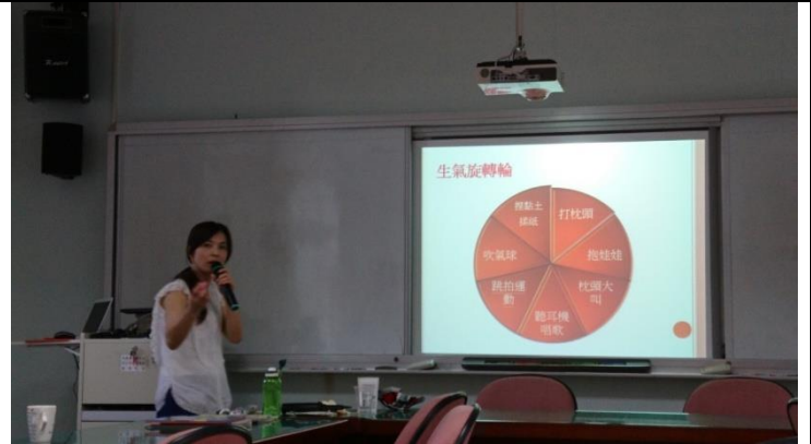
說明 8：紓解負面情緒的做法