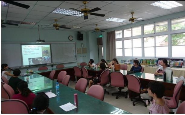
說明 7：說明大人情緒管理的重要性